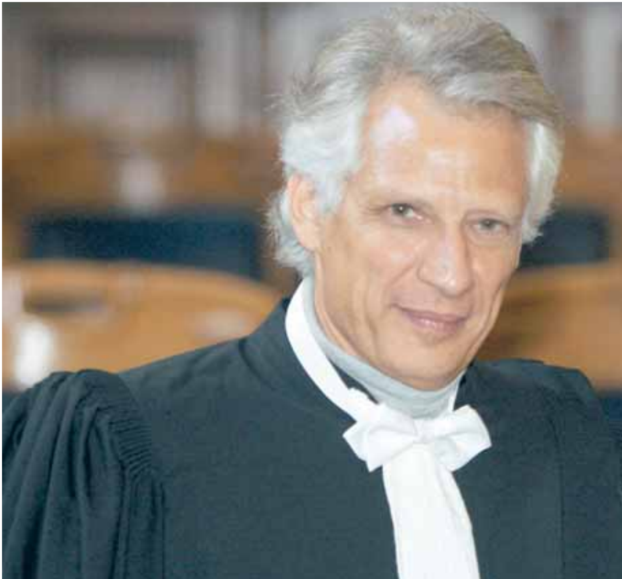
Dominique de Villepin (à gauche), ancien Premier ministre, a prêté serment le 9 janvier 2008 ; Noël Mamère (en haut à droite), député Vert, le 7 mai 2008 ; et Christian Pierret (en bas à droite), ancien ministre de l'Industrie, le 26 juin 2002.